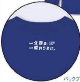
バックプリント (Tシャツ、ロンT共通)